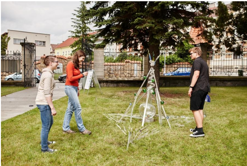
16.00 Studenti a poslední úpravy objektu