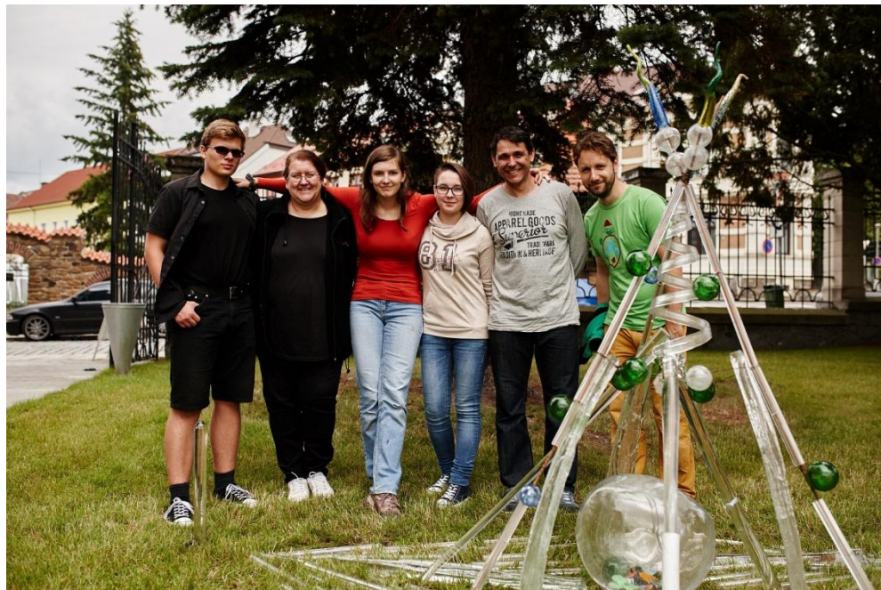
16.20 Vše je hotovo dříve, než bylo plánováno