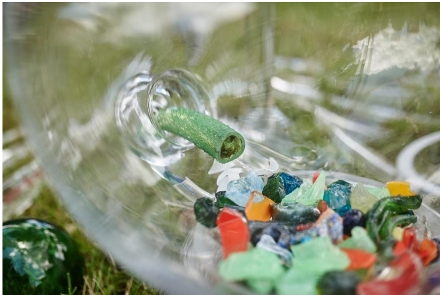
17.01 V baňce symbolicky sublimují střepty slavného šumavského skla Loetz.