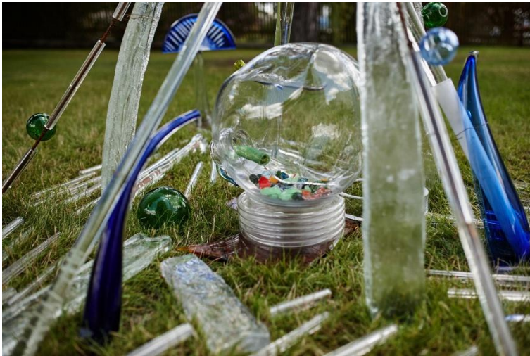
17.00 Centrem objektu je baňka.