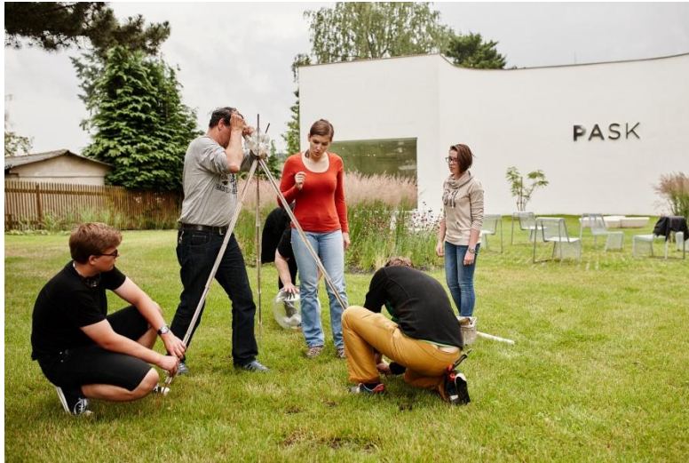
14.35 Konstrukce musí držet.

14.35 Už zase poměrně hustě prší, návštěvníci mají na rozdíl od výtvarníků výhodu deštníků.