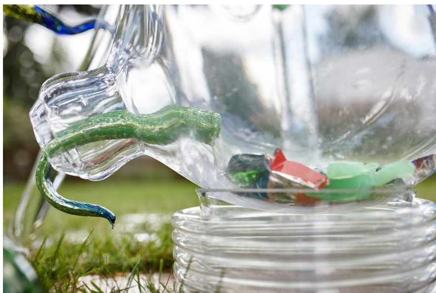
17.02 A poté vytéká zkapalněné umění šumavských sklářů do současnosti, aby ji obohatilo.