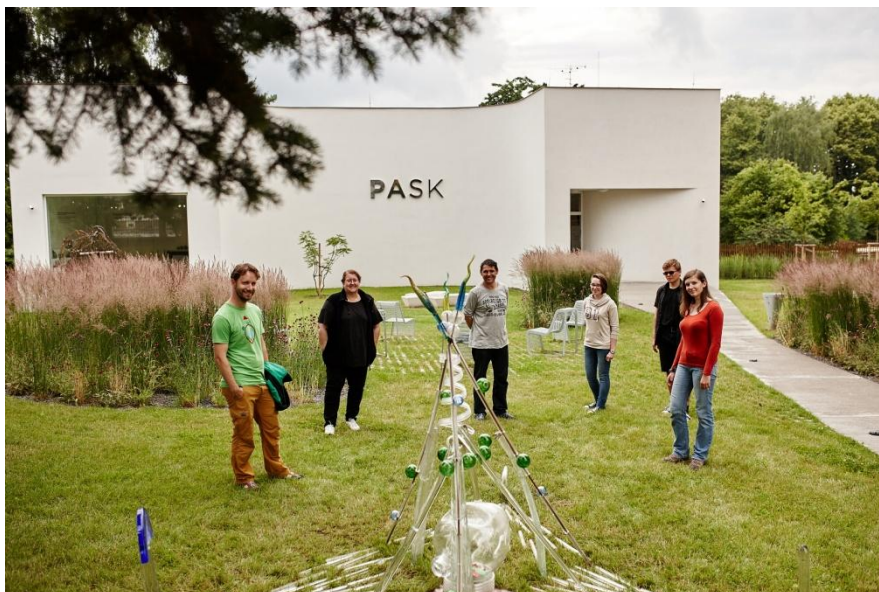
16.22 Zahrada PASKu bude mít na léto mimořádně zajímavý doplněk.